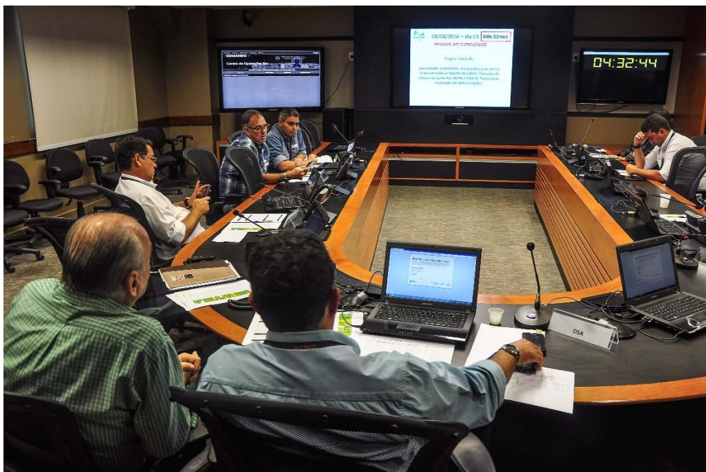
Figura 1 Ambiente da Sala de Gestão de Crise