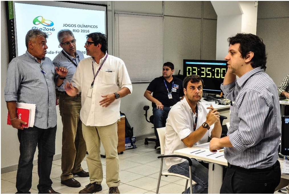
Figura 3 Diretores Operacionais na Sala Cenário