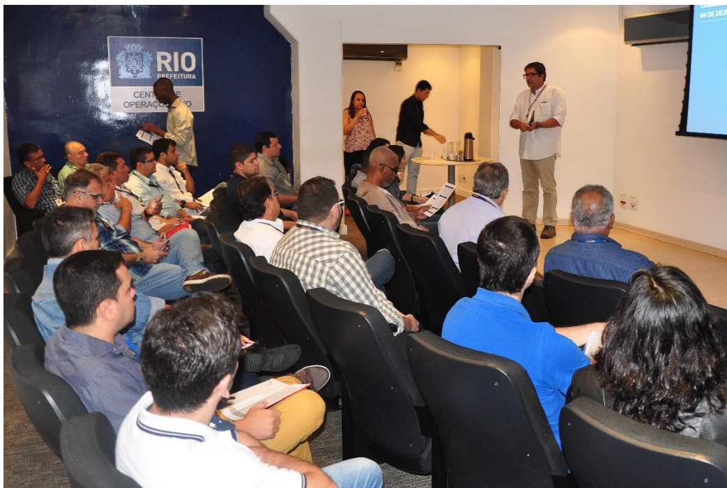
Figura 5 Debriefing