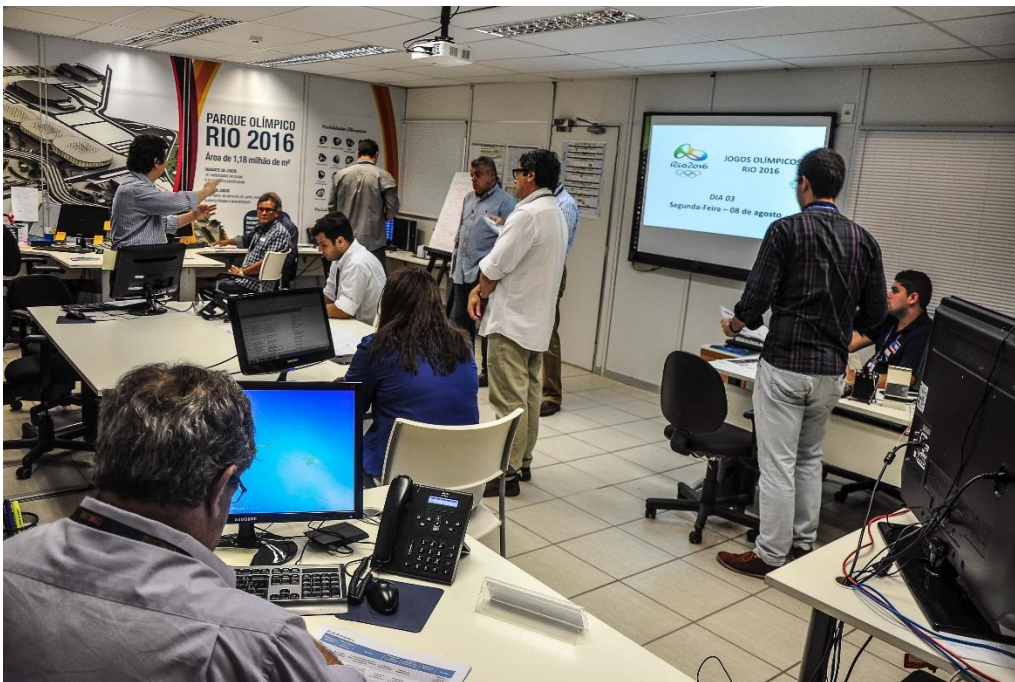
Figura 4 Ambiente da Sala Cenário