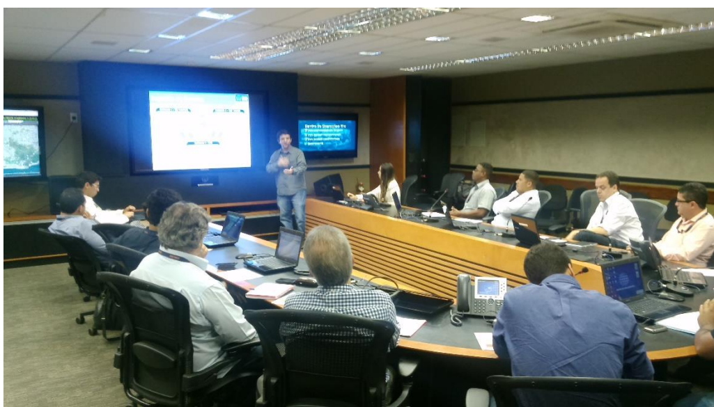
Figura 6 Orientação Pré Simulado