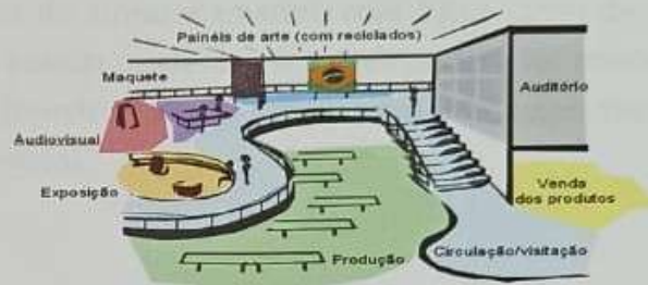
Figura 4 - Centro Municipal de Valorização de Recicláveis (CMVR)