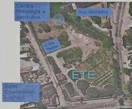
Figura 3 - Centro Municipal CISA – Oeste