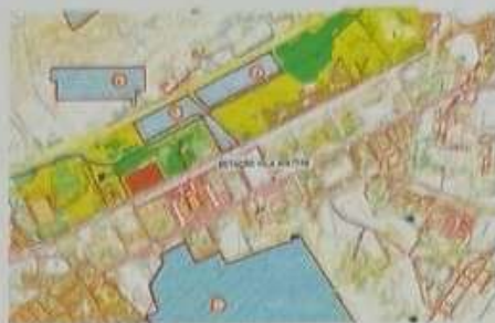
Figura 5 – Parque Deodoro