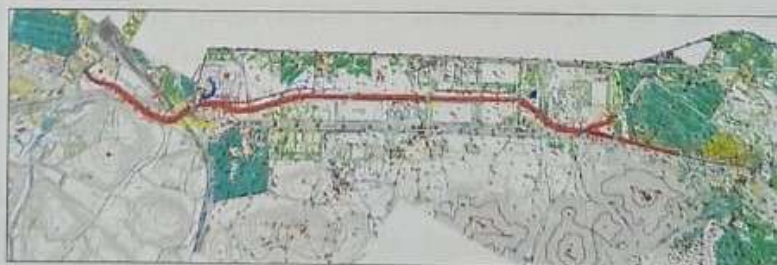
Figura 2 - Localização do rio Marangá para implantação da calha de projeto