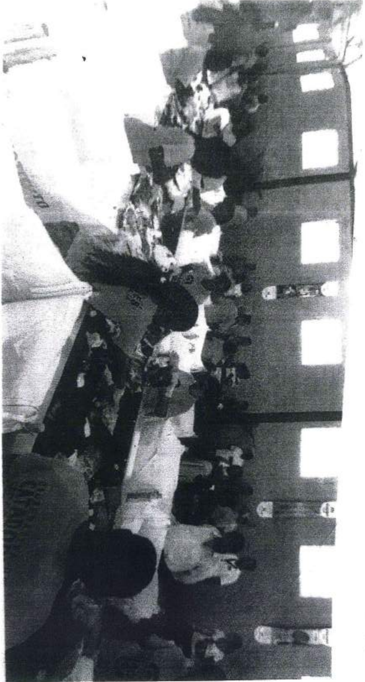
Students of the University of Chicago